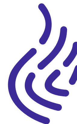
Одноцветная версия в синем цвете. Используется для печати на ч/б принтере, гравировке на сувенирной продукции