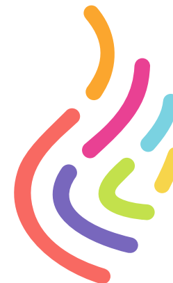
Полноцветная версия. Основная версия эмблемы. Используется для полноцветной печати

Одноцветная версия используется в тех случаях, когда полноцветная печать невозможна.